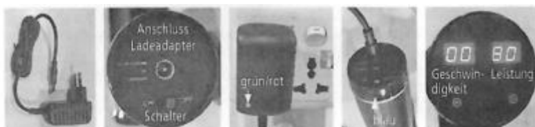
nabíjecí adaptér zadní strana masážního přístroje obr. 1 obr. 2 obr. 3