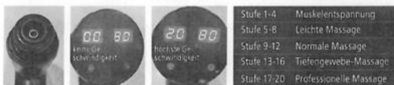
přední otvor 2 3